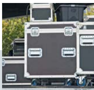
Eventi e costruzione di palchi