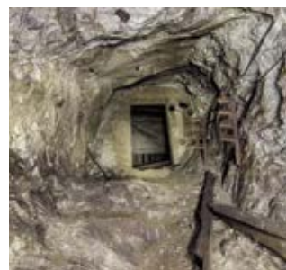
Costruzione in acciaio e miniere