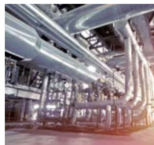
Costruzione di caldaie